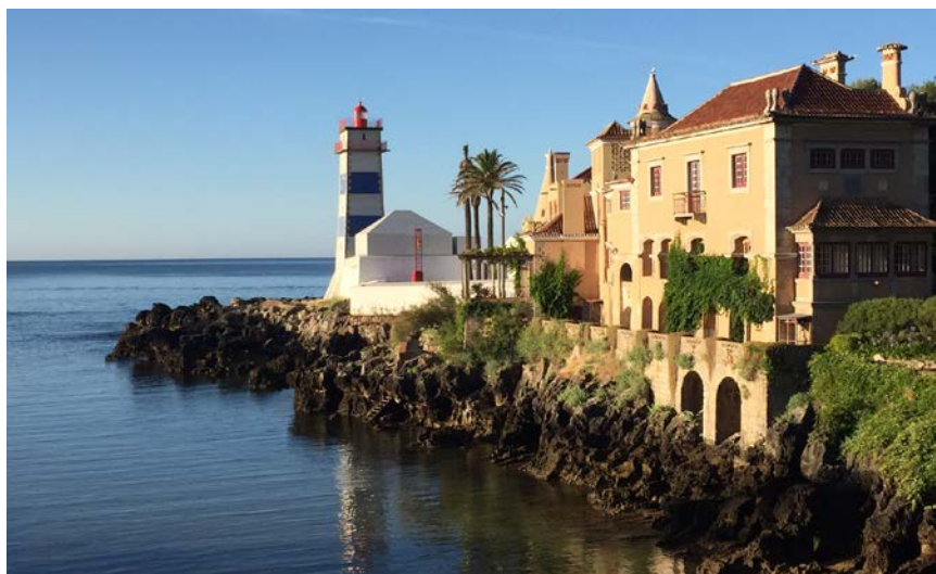
Fyren Cabo de Santa Maria