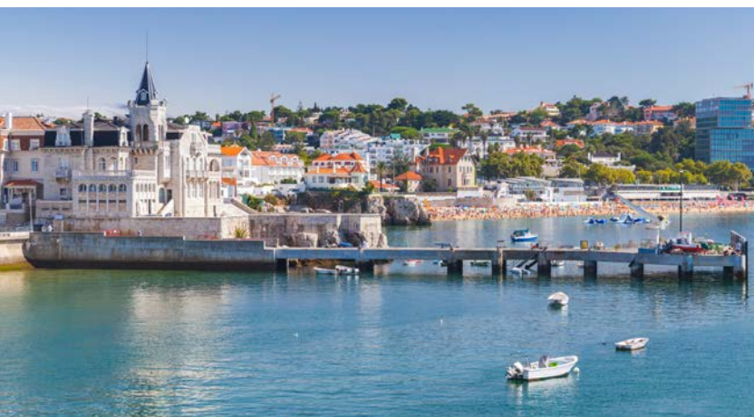
Cascais kommun, ca 3 mil väster om Lissabon, är en av Infracontrols kunder.

Ett starkt team kan nå hur långt som helst. Beställ ditt eget exemplar av Infracontrol Magazine 2023 på vår hemsida!