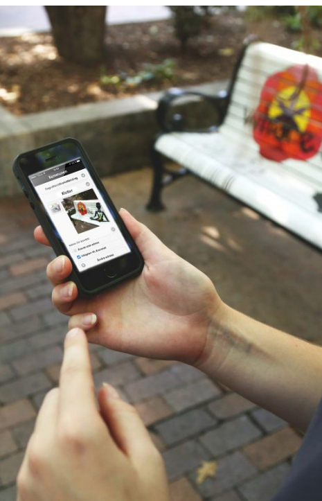
Rapportering av fel och synpunkter via Infracontrol Online kan belönas med City Points.

Han säger att ett test bör begränsas i sin omfattning så att man inte gör det för stort och komplicerat. Därefter kan man enkelt skala upp det hela.