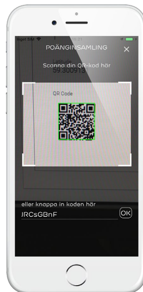
Poängen samlas genom att verifiera med QR-kod och GPS-position.