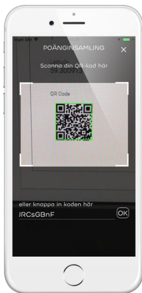
Insamlad skräp verifierades med en QR-kod