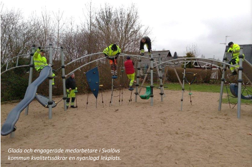
Glada och engagerade medarbetare i Svalövs kommun kvalitetssäkrar en nyanlagd lekplats.

När en felanmälan kommer in skapas en arbetsorder som sedan skickas ut till entreprenörerna. När felet är åtgärdat, återkopplar kommunen till medborgarna för att hålla igång en god dialog och en ökad känsla av närhet och trygghet.