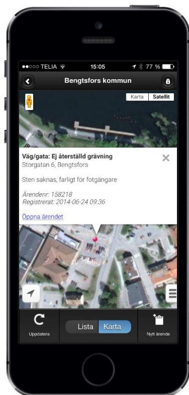
Mobilappen underlättar åtgärdande och rapportering direkt på plats.