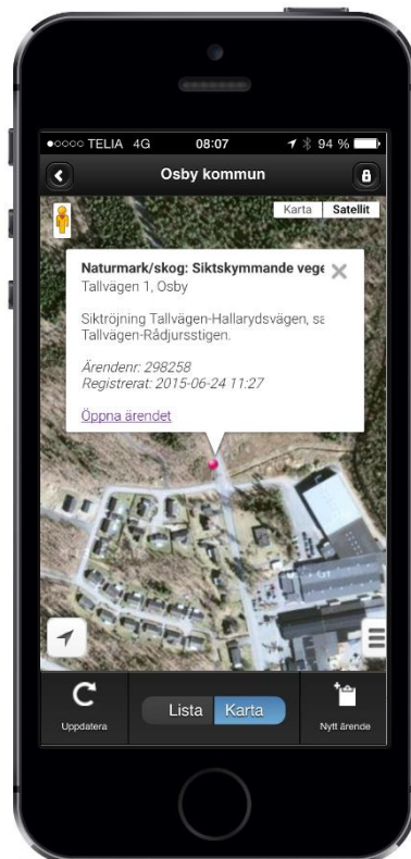
Mobilappen underlättar åtgärdande och rapportering direkt på plats.