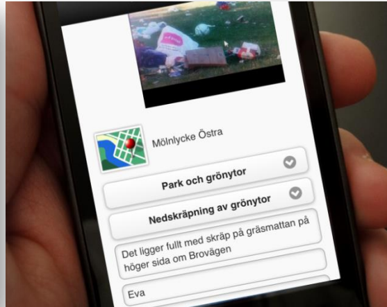
App för smarta telefoner och surfplattor