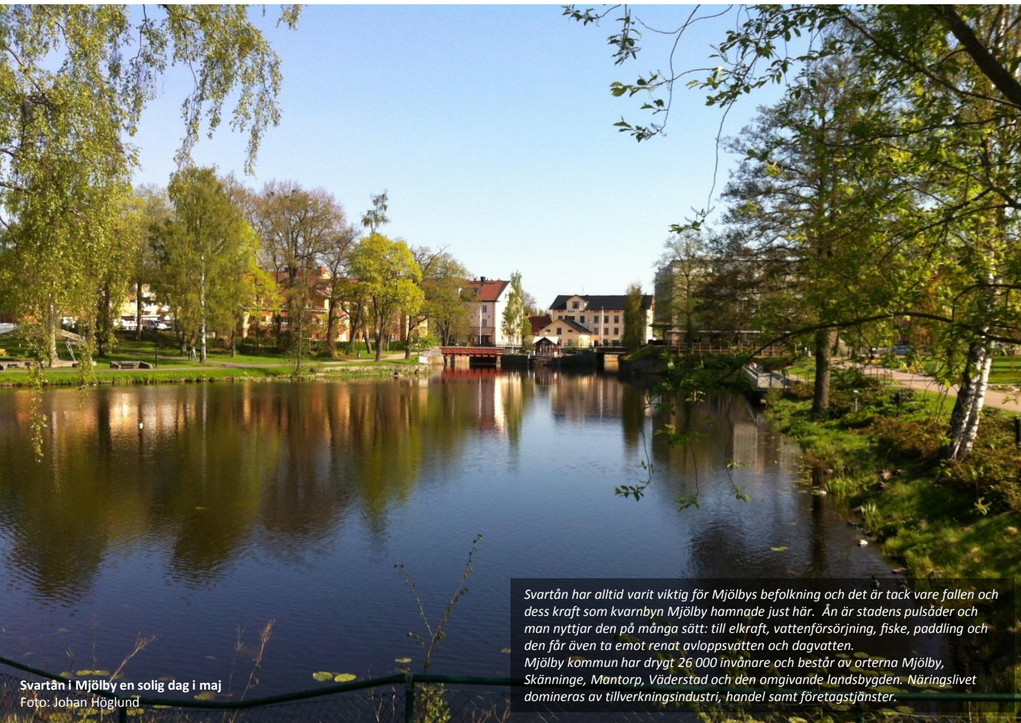
Svartån i Mjölby en solig dag i maj

Svartån har alltid varit viktig för Mjölbys befolkning och det är tack vare fallen och dess kraft som kvarnbyn Mjölby hamnade just här. Ån är stadens pulsåder och man nyttjar den på många sätt: till elkraft, vattenförsörjning, fiske, paddling och den får även ta emot renat avloppsvatten och dagvatten. Mjölby kommun har drygt 26 000 invånare och består av orterna Mjölby, Skänninge, Mantorp, Väderstad och den omgivande landsbygden. Näringslivet domineras av tillverkningsindustri, handel samt företagstjänster.