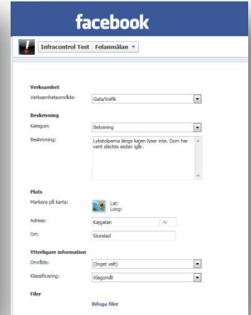
Formulär på Facebook