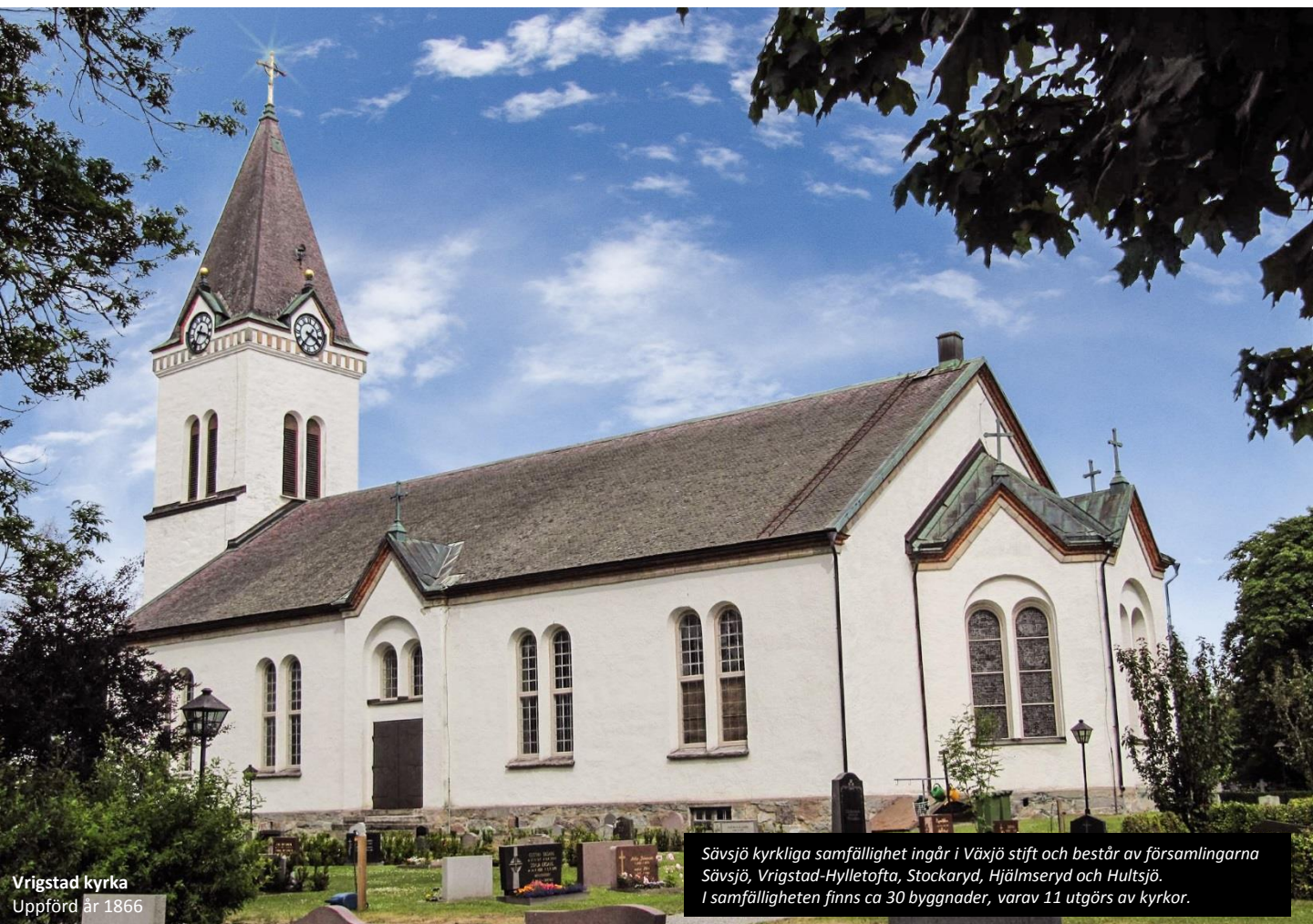
Vrigstad kyrka Uppförd år 1866

Sävsjö kyrkliga samfällighet ingår i Växjö stift och består av församlingarna Sävsjö, Vrigstad-Hylletofta, Stockaryd, Hjälmseryd och Hultsjö. I samfälligheten finns ca 30 byggnader, varav 11 utgörs av kyrkor.